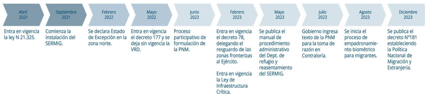
Figura 1. Principales Hitos de la Política Nacional de Migración y Extranjería.

Además de estos hitos, en este informe se examinan algunos proyectos de ley, que se han orientado a limitar el acceso a los estatutos de protección internacional y otros permisos de residencia, mientras que paralelamente hay otros que han buscado facilitar y agilizar el proceso de expulsión de refugiados y migrantes mediante una flexibilización de las garantías de un procedimiento justo y racional y sin salvaguardas que garanticen el principio de no devolución. En este contexto, el informe “seguimiento de la Política Nacional de Migraciones y la Ley de Refugio” busca realizar un seguimiento y análisis sobre la elaboración de la Política Nacional de Migraciones, a partir de la siguiente pregunta central: ¿Cómo aborda la propuesta de Política Nacional de Migración y Extranjería el acceso a procedimientos y derechos de las personas extranjeras en Chile? El documento se estructura en tres secciones. En la primera se presenta el marco conceptual del análisis, delimitando la parte del ciclo de las políticas que se analizará en este caso y la vinculación de la PNM con las leyes migratorias y de refugio. La segunda sección muestra el análisis de algunas de las principales medidas de la PNM. Finalmente, en la última sección se ofrecen recomendaciones para mejorar la política migratoria.