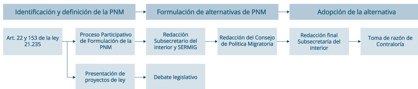
Figura 3. Estado del ciclo de la política migratoria a la PNM 2023.

Otra particularidad importante para considerar es que la PNM contempla 15 proyectos de ley, los cuales fueron presentados al congreso sin esperar la toma de razón de la Contraloría para entrar en la discusión legislativa (para su revisión detallada, consultar el anexo 2). Entre los 15 proyectos de ley examinados en este informe, el 73% se centra en la implementación de medidas de expulsión, prohibiciones de ingresos o procedimientos sancionatorios diseñados para desalentar el ingreso por pasos no habilitados.