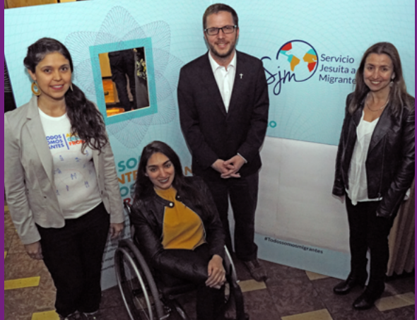
Gala 18 años Servicio Jesuita a Migrantes"