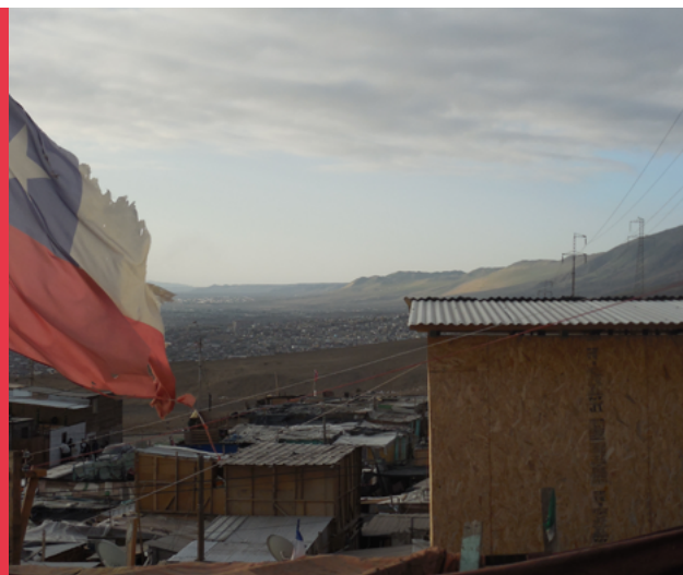
Campesinato en Antofagasta.