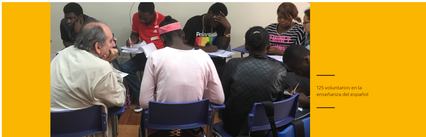
125 voluntarios en la enseñanza del español

El Área de Incidencia del Servicio Jesuita a Migrantes, busca transformar las políticas chilenas en materia de migración e inclusión de las personas que vienen a vivir a Chile con un enfoque de derechos, por medio de la generación de contenidos, evidencia empírica y propuestas. Junto con ello, busca promover una visión social y política de mayor apertura hacia la migración, por lo cual su plan estratégico tiene como objetivo incidir en el Estado, en pro de la construcción de una sociedad más inclusiva y abierta a la diversidad. Esto considera líneas de acción orientadas a desarrollar en el país una política migratoria integral, que tenga su aplicación en políticas públicas sectoriales o en procesos administrativos no inclusivos. Su contenido se fundamenta en las observaciones y las situaciones recogidas y sistematizadas desde el trabajo directo de la Fundación.