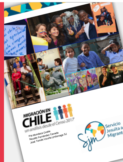
Migración en Chile, un análisis desde el Censo 2017