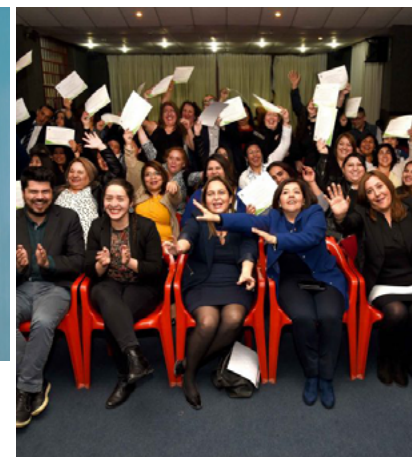
Egresados de infocap certifican sus competencias como ayudantes de cocina