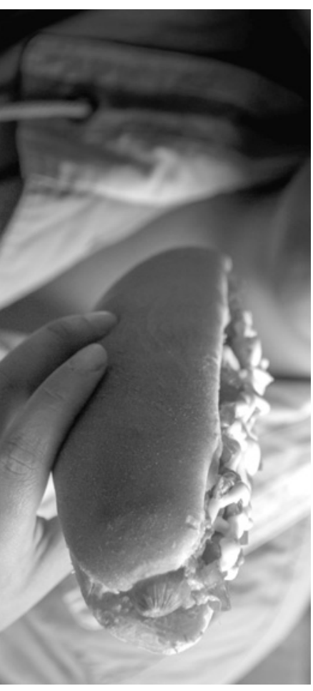
Kompleto / Completo

Moun chili travay anpli yo yon tijan serye nan travay men yo fasil pou fe zanmi avek ou, si ou vin konnen yo, yap tré solid avek ou si ta nan yon move moman. Menmjan tankou ayiti chili te pase tranbleman de té ak lot seyis. Men nou abitye ak sa e pafwa se pa tro fò espò ki pi popilè se foutbol, nou remmen we jwe chilyen yo genyen, se poutèt sa nou rasanble; zanmi, fanmi pou fè fet. Si w ta remmen kon chili ou gen pou gouste manje nou, ki se bouyon “cazuela” pate “empanada de pino” ak “kompleto” yo.